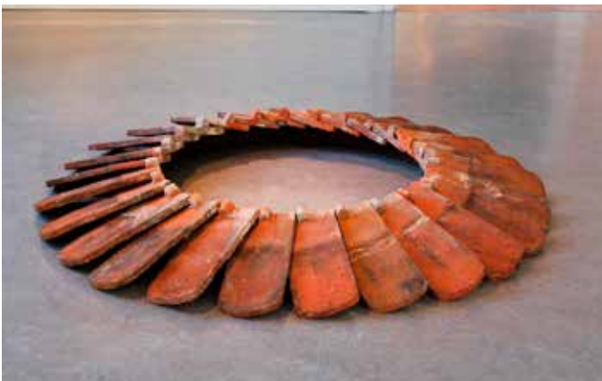
Værk af Jens Chr. Jensen