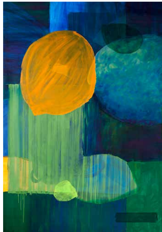
Værk af Grazyna Gotz