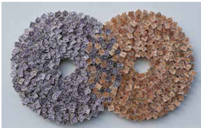
Værk af Jens Chr. Jensen