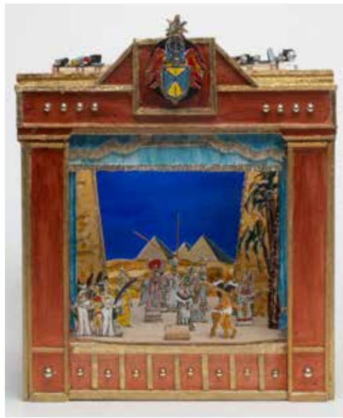
Værk af Georg Metz

Din klasse / børnegruppe inviteres til omvisning med efterfølgende workshop til udstillingen