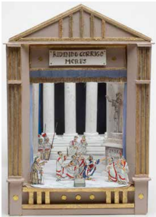
Værk af Georg Metz